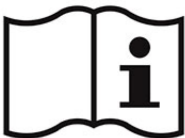
Volg instructies op

Wij houden ons aan de richtlijnen van het RIVM en vragen alle gasten om dit ook te doen.